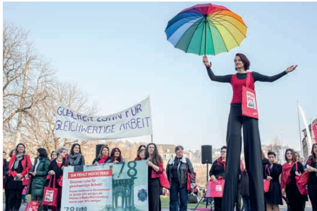
21. März 2015: Aktion der Gewerkschaftsfrauen am Equal Pay Day auf dem Stuttgarter Schlossplatz

Erstmalig wurde vier Monate vor Ablauf der festgesetzten Frist in Artikel 117 des Grundgesetzes im Bundestag über die nötigen Gesetzesreformen diskutiert. Die Fronten waren verhärtet. Die konservativ/liberalen Regierungsparteien, sowie der damalige Bundeskanzler Konrad Adenauer (CDU) blockierten den Prozess der Gleichstellung. Der Kanzler beharrte auf dem sogenannten Stichentscheid – dem „Letztentscheidungsrecht“ des Mannes in strittigen Ehefragen wie der Wahl des Wohnorts. Für Streit sorgten auch andere Punkte, wie etwa die Festlegung des Familiennamens und die Entscheidung über die Erwerbstätigkeit der Ehefrau. Es dauerte bis