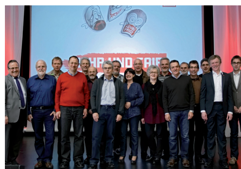
Der neue Ortsvorstand der IG Metall Stuttgart