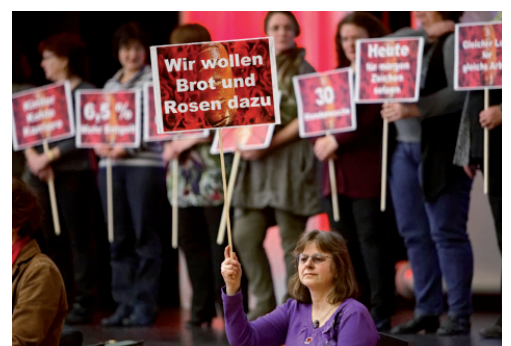
Der OFA Stuttgart auf der Delegiertenversammlung