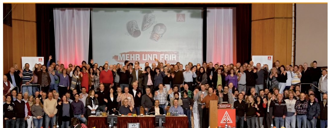
Die 200 Stuttgarter Delegierte aus 57 Betrieben.

Mehr Informationen gibt's auf: ● www.stuttgart.igm.de