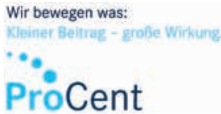
Eine Initiative von Mitarbeiterinnen und Mitarbeitern der Daimler AG gemeinsam mit Gesamtbetriebsrat, Konzernsprecher Ausschuss und Unternehmensleitung.

Darauf aufmerksam geworden bin ich vor einigen Jahren, als ich selbst auf der Suche nach einem geeigneten Haustier war. Damals schon stand außer Frage, dass die neuen Familienmitglieder von einer seriösen Tierschutzorganisation kommen sollen. Nach einiger Recherche war klar, dass respektTiere e.V. diesen Anspruch vollumfänglich erfüllt. Seitdem leben zwei stolze sardische Stubentiger in unserer Familie und bereichern unseren Alltag.