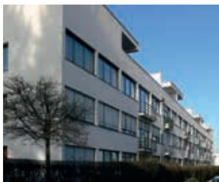
Mies van der Rohe Block – Mies van der Rohe Block

Das Bauhaus zählt zu den bedeutendsten Innovationen in der Architekturgeschichte des 20. Jahrhunderts. Walter Gropius, Ludwig Mies van der Rohe und Hannes Meyer gehören zu den Protagonisten der dieser spektakulären Gründung, die 1919 ihren Anfang in Weimar nahm. 1925 wurde die Schule nach Dessau verlegt, nachdem die Nazis in Thüringen an die Macht gelangt waren. Von dort musste das Bauhaus 1932 nach Berlin ausweichen, wo es 1933 nach der sog. „Machtergreifung“ geschlossen wurde. Auf dem Stuttgarter Weißenhof veranstaltete das „Neue Bauen“ 1927 eine einzigartige Leistungsschau seines Könnens! Stararchitekten aus ganz Europa waren hier vertreten. Der Stil des Bauhauses wurde international. Begeben Sie sich auf Spurensuche!