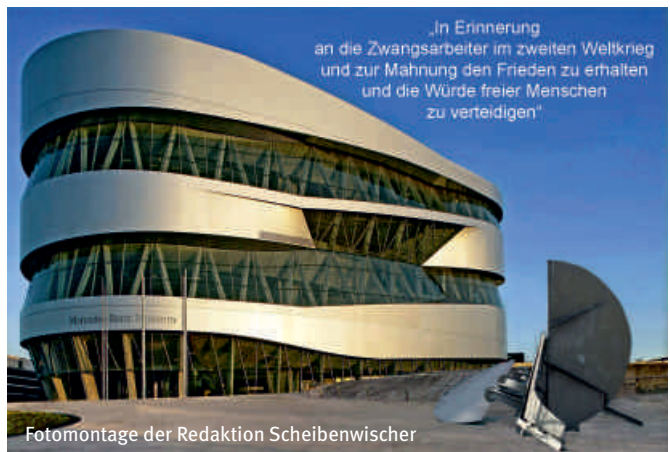
Fotomontage der Redaktion Scheibenwischer

Weitere Infos gibt es unter Daimler.com , Bundeszentrale für politische Bildung www.bpb.de , Zukunft-braucht-erinnerung.de