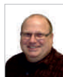
Dietmar Strecker Redaktion Scheibenwischer Tel: 2 43 69

dienen und nicht umgekehrt. Dafür brauchen wir stabile Rahmenbedingungen für alle Beschäftigten auch in Zeiten, in denen alles fluider wird – egal, ob sie fest angestellt sind oder als klassische Soloselbstständige oder Crowdworker ihr Geld verdienen. Soziale Absicherung, faire Bezahlung und Gesundheitsschutz sind Standards, für die wir lange gekämpft haben. Diese müssen auch in der digitalen Welt gelten. Das zu regulieren ist jetzt Aufgabe von Unternehmen, Gewerkschaften und Betriebsräten. Wir sehen durchaus die Chancen von digitaler Arbeit und internem Crowdsourcing mit ihren enormen Innovations- und Produktivitätspotenzialen, die wir im Interesse des Wirtschaftsstandorts Deutschland, aber auch im Interesse der Beschäftigten ausschöpfen wollen.